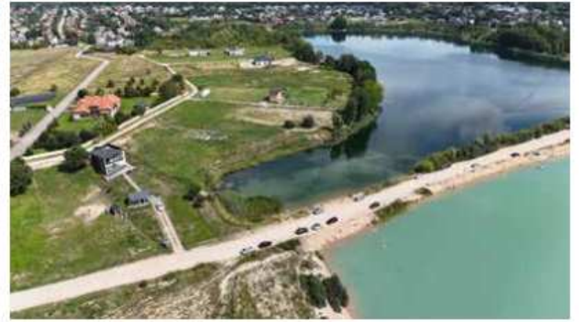
Individualių namų kvartalas ir žalioji poilsio zona Kauno mieste, greta iškasto Vaišvydavos smėlio telkinio, 2024 08 08.