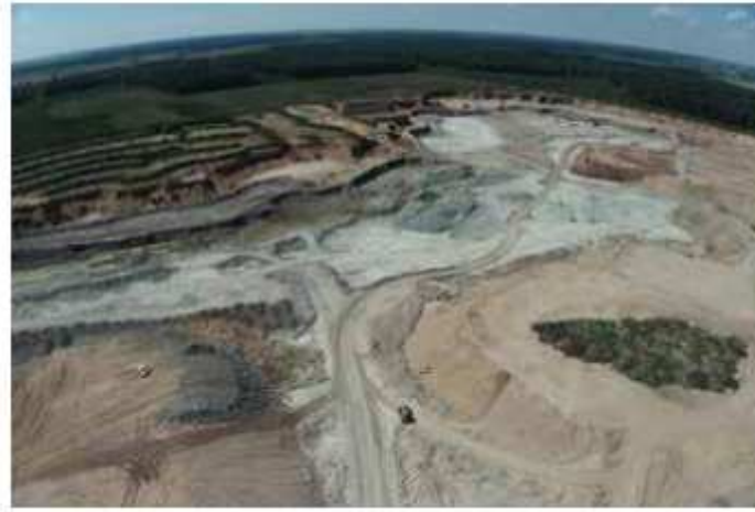
Petrašiūnų II dolomito karjeras, 2024 m.

Statybų technologijų raida reguliuoja mineralinių medžiagų gavybą bet kurioje šalyje. Lietuvoje daugiausia iškasama žvyro, smėlio ir dolomito, kurie naudojami kelių ar geležinkelių tiesimui, betono ir gelžbetonio dirbinių gamybai. Su šiais dirbiniais nuolat susiduria visi. Tačiau statybų technologijos taip pat keičiasi. Praeityje pastatų statybai buvo gausiai naudojamos keraminės plytos, blokeliai ir keramzitas. Pasikeitus technologijoms, poreikis tokiai statybinei keramikai rinkoje labai sumažėjo. Šiandien Lietuvoje nebėliko nė vienos gamyklos, gaminančios statybines medžiagas iš molio. Praėjusio amžiaus viduryje plytinės veikė vos ne kiekviename rajone ir net ne po vieną. Šiuo metu kasamas triaso periodo molis naudojamas tik cemento gamybai. Tai normalus procesas, kurį civilizacija patiria istorijos eigoje. Lietuvoje taip atsitiko ir su titnagu, naudotu akmens amžiuje, ir su balų rūda (limonitu), naudota geležies amžiuje.