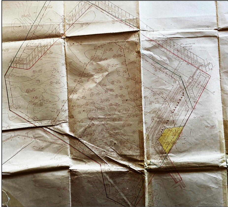
3.1.1 pav. Kapitalinių darbų planas (telkinio naudojimo (kasybos-rekultivavimo) projektas, 1992 metai)

geometriją tikslinti geodezinių matavimų metu. Žemės sklypo plotas gali keistis leistinų paklaidų ribose.