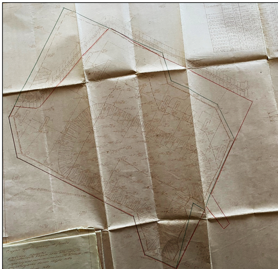
3.1.2 pav. Kalendorinis kvarcinio monomineralinio smėlio išteklių gavybos darbų planas (telkinio naudojimo (kasybos-rekultivavimo) projektas, 1992 metai)