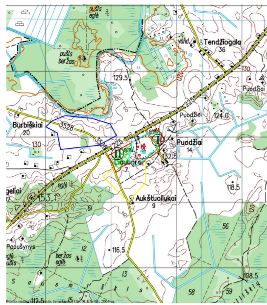
(pagrindas yra TOP50LKS-SR informacija, 2004. © Nacionalinė žemės tarnyba prie Žemės ūkio ministerijos)